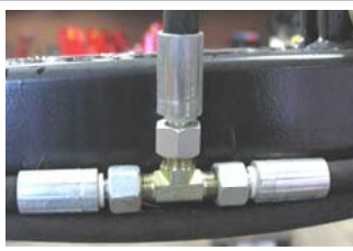
DUC501156 T-stykke DUC108041 slangekobling