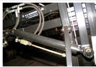
DATRA05194 pilotventil for cylinder