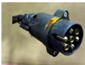
GR1420251500 7-polet stik