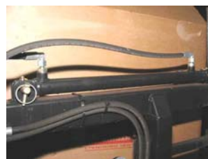
DT3220500FH20FH20 cylinder for udskyder