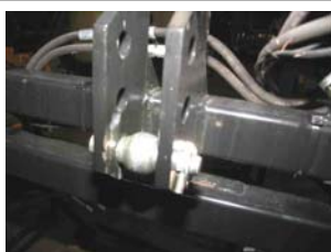
BUSP69 topstangsbolt GR1302101000 ringsplit