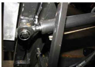
DATRISIOTS25AR ledleje DATRISIOTS25PR ledleje