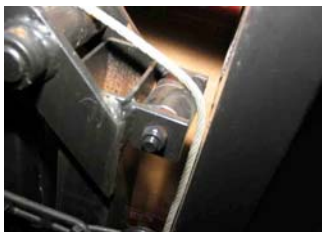
GR1560200408 wire PN101 wirerulle