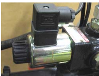
DT4007425 spole DUC8959008 stik for ventil