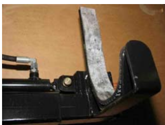
PN103 øverste bæresadel