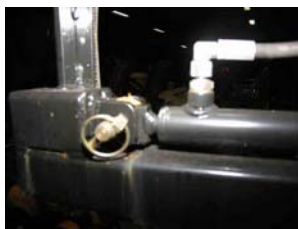
GR1335301010 bolt GR1302101000 ringsplit