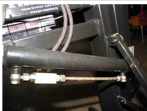
DATRISI0502540 cylinder for arme