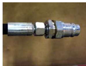
DUC8949005 lynkobling han